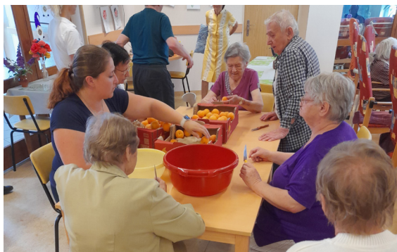
Léto, slunce, ovoce